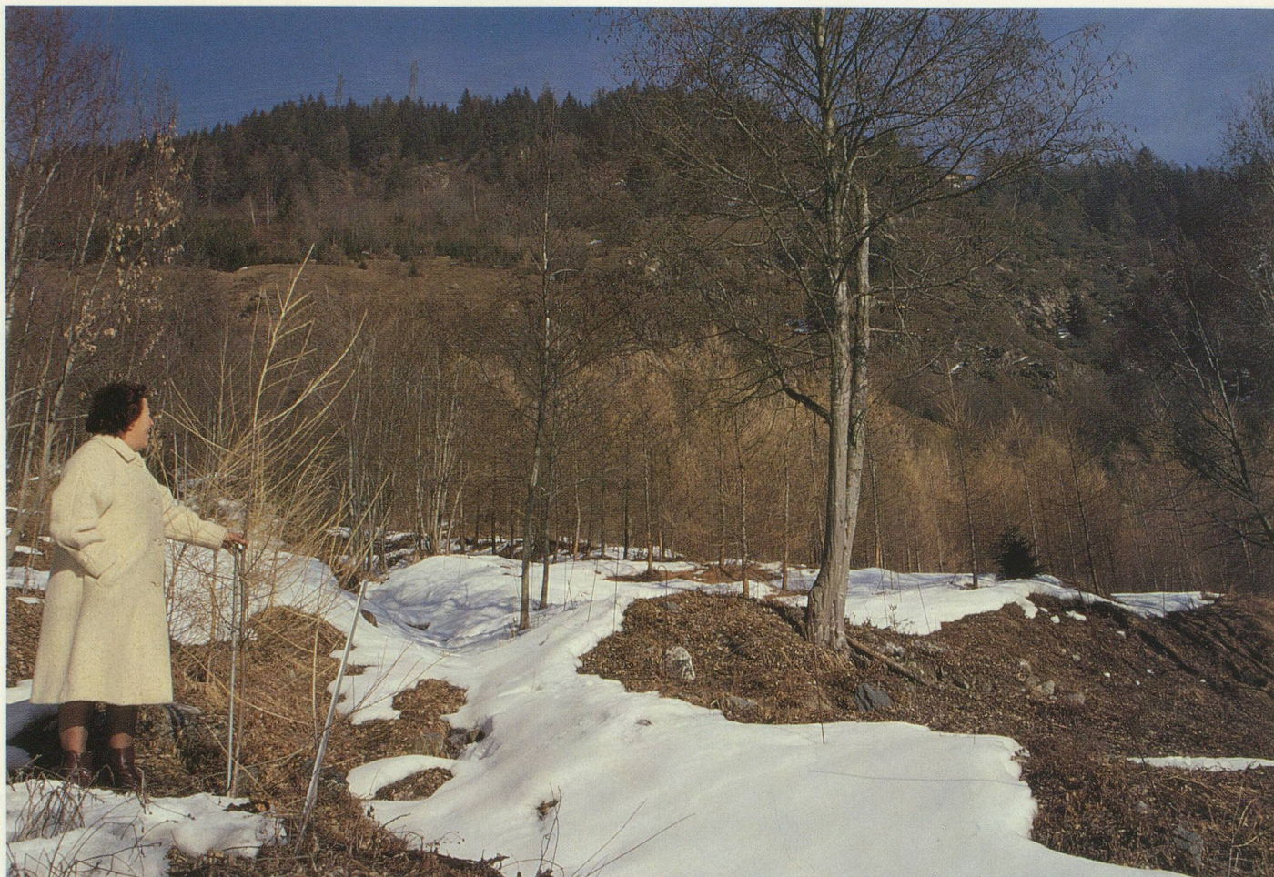
A la forêt des Epeney... un véritable travail de garde-forestier!