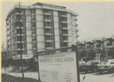
La Résidence Colladon