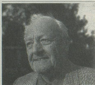
Cabédita Collection Espace et Horizon

Une recherche conduite sur les aînés et pour les aînés mais aussi, ce qui est plus original, par des aînés: c'est ce que nous présente une équipe de l'Université du 3 e âge de Genève au terme d'une pénétrante enquête sur le vécu et les conséquences du veuvage féminin. Fondée sur les interviews d'une série de veuves, cette étude présente un florilège de témoignages où ces femmes disent comment elles subissent leur solitude ou par quels chemins, au travers du «travail du deuil», elles ont appris à l'apprivoiser, peut-être à la transcender.