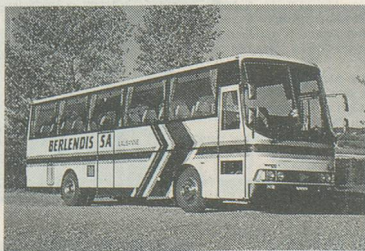
Le car qui vous emmènera sur les hauteurs de la station

Pour vous inscrire: Voyages Berlendis, avenue de la Gare 6, 1003 Lausanne, tél. 021/20 50 45. Mentionnez le voyage d'Aînés à Ovronnaz, tout en précisant votre lieu de domicile. A bientôt sur les hauteurs valaisannes!