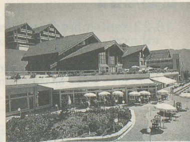
Le centre thermal d'Ovronnaz

Pour vous inscrire: Voyages Berlendis, avenue de la Gare 6, 1003 Lausanne, tél. 021/20 50 45. Mentionnez le voyage d'Aînés à Ovronnaz, tout en précisant votre lieu de domicile. A bientôt sur les hauteurs valaisannes!