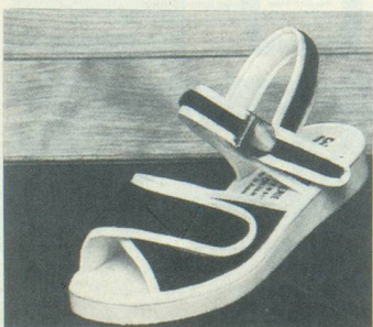
STAR N°1 Marine Fr. 71.-