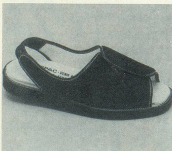
FORMEN N°1 Marine Fr. 77.-

(Veuillez indiquer le nombre de paires dans les cases correspondantes, s.v.pl.)