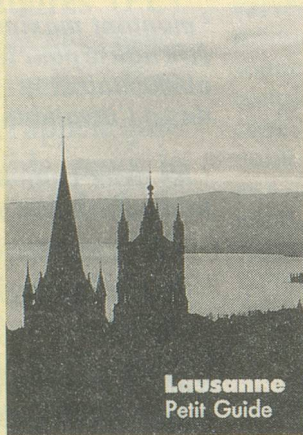
Lausanne Petit Guide