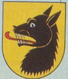
CORBEYRIER les Voleurs de Loup