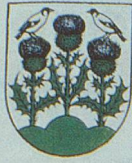
CHARDONNE les Chardonnerets