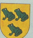
COURNILLENS les Penoillons