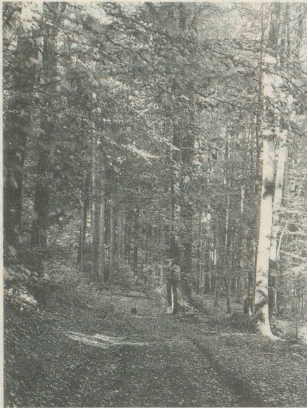
Les arbres de la forêt sont générateurs d'air pur.