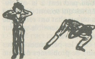
Position de départ mains derrière la nuque, pieds serrés, écarter la jambe vers la droite en se penchant en avant dos droit, la jambe pliée. Le pied de la jambe en appui reste face.