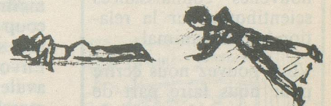
En appui sur les bras fléchis, écarter les jambes et les serrer.