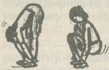
Départ jambes tendues corps fléchi, mains aux mollets. Fléchir les genoux en gardant les talons au sol.