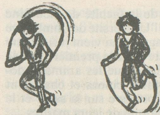
Saut à la corde ou marcher sur place cinq minutes.

Comme par exemple le ski de fond, un sport idéal pour les personnes âgées; il est très complet et peut être pratiqué moyennant un peu d'entraînement préalable. Voilà quelques suggestions. ■