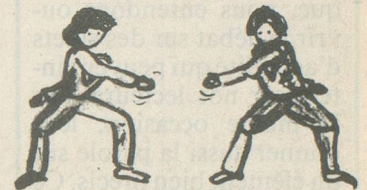
Jambes fléchies pieds en dehors, boxer à droite et à gauche.