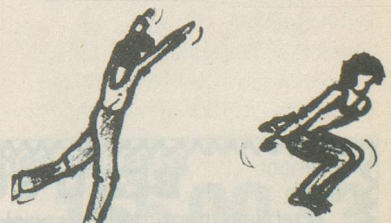
Extension des bras et d'une jambe, corps légèrement penché vers l'avant, flexion des jambes avec ressort en ramenant les bras vers l'arrière.