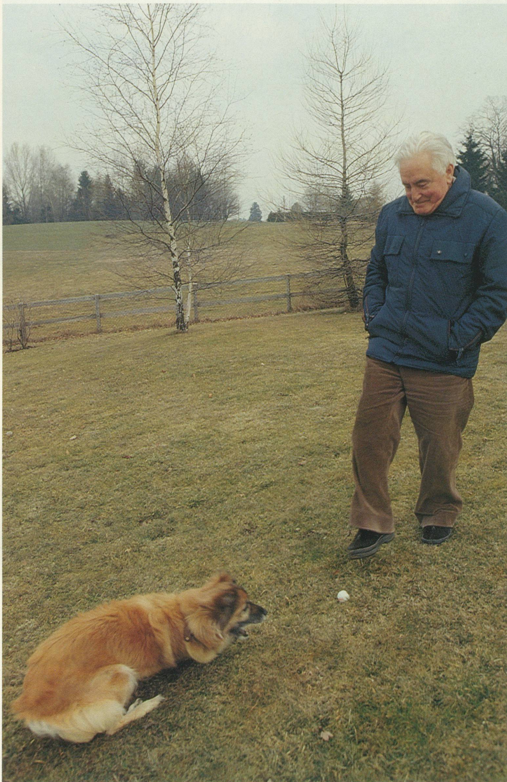
Avec sa chienne Navette, berger des Pyrénées de 13 ans.

Ancien président de la Confédération, Georges-André Chevallaz est aujourd'hui à la retraite. Une retraite pas comme les autres, parce que cet ancien historien continue à écrire, à vaquer à diverses occupations, tout en se maintenant en forme en se promenant et, en saison, en pratiquant du ski de fond. Il vient notamment de rééditer une nouvelle version des volumes consacrés à l'Histoire générale, édités par Payot Lausanne. Nous l'avons rencontré chez lui, à Epalinges s/Lausanne, où il vit une retraite active avec son épouse et sa chienne Navette.