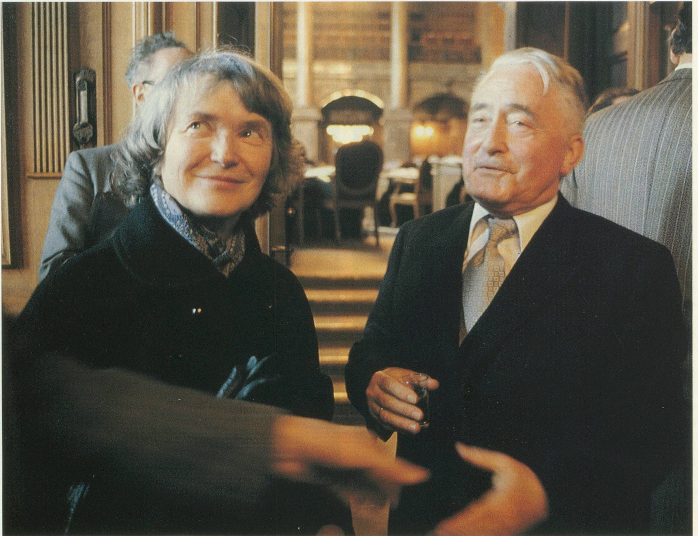
Le nouveau président de la Confédération, le jour de son élection, accompagné de son épouse, le 7 décembre 1979.

nous parlons de la vie d'aujourd'hui... je suis toujours en rapport avec le chef de l'état-major général. Il y a tant d'événements, que c'est difficile de tout commenter.» Et l'armée? «Elle doit être réorganisée et rajeunie! On ne peut plus, aujourd'hui, garder de tels budgets. On doit cependant conserver les règles de disciplines élémentaires, c'est indispensable.»