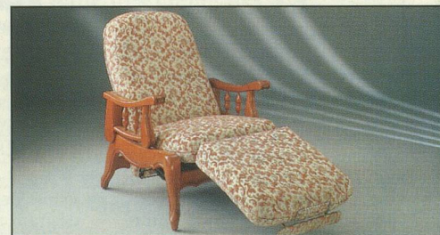
Everstyl « Elysée » fauteuil rustique

Notre catalogue gratuit vous présente un grand choix de modèles (rustique, contemporain, style) et de revêtements : velours, très beau cuir et cuir de synthèse. Finition « décoration », robustesse à toute épreuve : Everstyl est bâti pour défier le temps... Profitez de son prix « vente directe usine », dans toute l'Europe, sans intermédiaire.