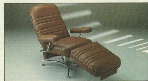
Everstyl « Trocadéro » ligne mode contemporaine