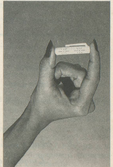
Une réponse non violente à la violence.

Pour celles (et ceux) que cela intéresse, sachez que «Rapel» se trouve en vente dans les drogueries, depuis ce printemps, au prix de Fr. 39.-.