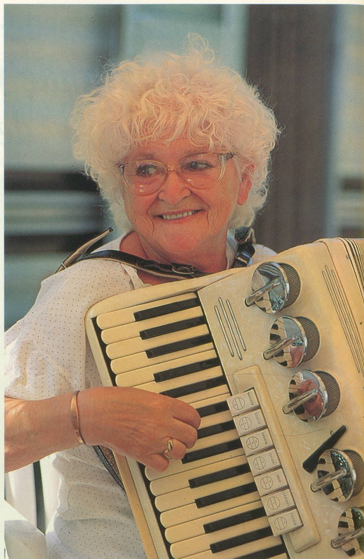
Accordéoniste au Moulin Rouge dans sa jeunesse, Aimée a, elle aussi, rejoint les retraités des «Cabanes».