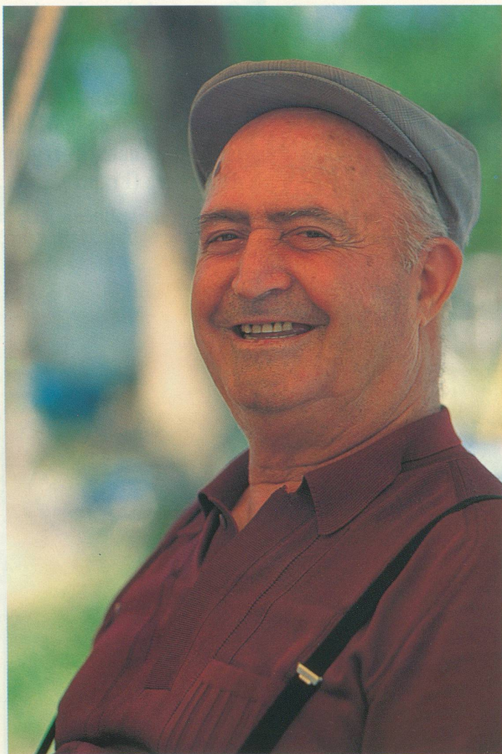
Manou: rien de tel pour traquer la solitude!