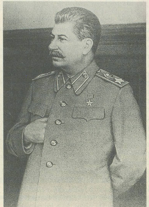
Staline, l'«homme d'acier», à l'époque si puissant qu'il était devenu en URSS, un demi-dieu.

Sa carrière débute en 1893 au Séminaire de Tiflis qu'il doit quitter un lustre plus tard pour avoir fondé un groupe d'études socialistes. Il se rend alors à Batoum, puis à Bakou, où il participe à la vie dangereuse des militants révolutionnaires. On l'arrête, on le déporte en Sibérie à trois reprises. Il s'évade et entre au comité du parti bolchévique en 1912, prenant à ce moment-là le nom de Staline. Arrêté à nouveau, puis libéré, il entre à la «Pravda» en qualité de chroniqueur et ne tarde pas à être nommé membre du Politburo et commissaire aux nationalités, ce qui fait de lui un des créateurs de la structure fédérale de l'URSS.