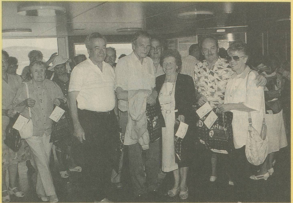
Les gagnants de la journée quelques instants avant de débarquer du bateau.

Renseignements et inscriptions au 021/36 17 21. Dès le 13 septembre, 021/646 17 21.