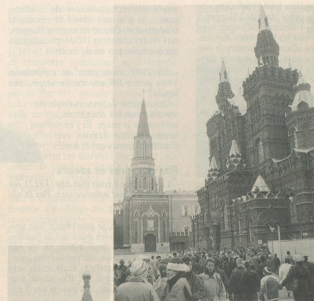
Des bâtiments superbes

Trois fois par semaine, nouveau vol Swissair Genève-Moscou: mercredi, vendredi et dimanche, départ 8 h 40, arrivée 14 h 30 (heures locales).