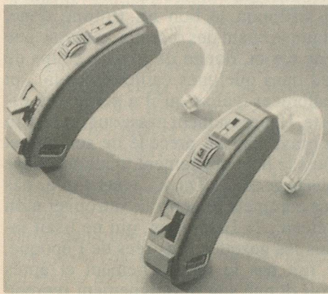
L'ordinateur auditif PICS permet le choix entre trois programmes d'écoute différents selon les besoins.

nateur auditif PICS qui s'ajuste digitalement. Il permet le choix entre trois programmes d'écoute différents selon les besoins (ex: milieu calme, bruyant et musique). Le grand avantage est que l'équilibrage stéréophonique se fait avec le spécialiste et se mémorise dans l'«ordinateur auditif». Evidemment, chaque appareil peut aussi être réglé séparément. Si l'effet stéréophonique ne se fait plus sentir, un seul bouton permet de le rétablir immédiatement! En cas d'oubli de la télécommande, les appareils peuvent aussi se manipuler comme des modèles traditionnels en augmentant le volume avec le potentiomètre et en les enclenchant à l'aide de l'interrupteur.