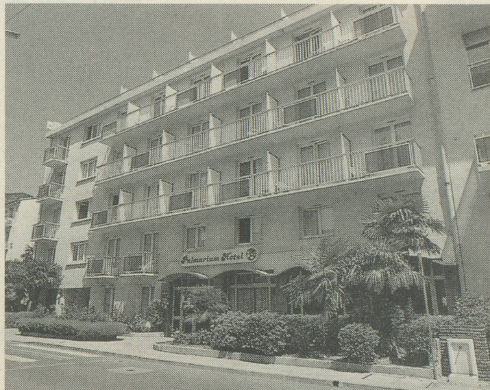
L'Hôtel Palmarium à Amélie- les-Bains

Prix avantageux: Toutes nos prestations: voyage, logement en chambre 2 lits, pension complète, excursions (exception faite de celle sur la Costa Brava.