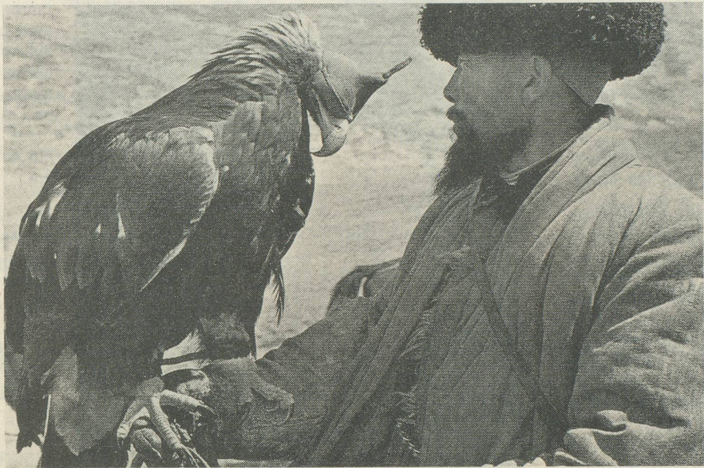
Vallée de la Brévine en 1976, par Monique Jacot.