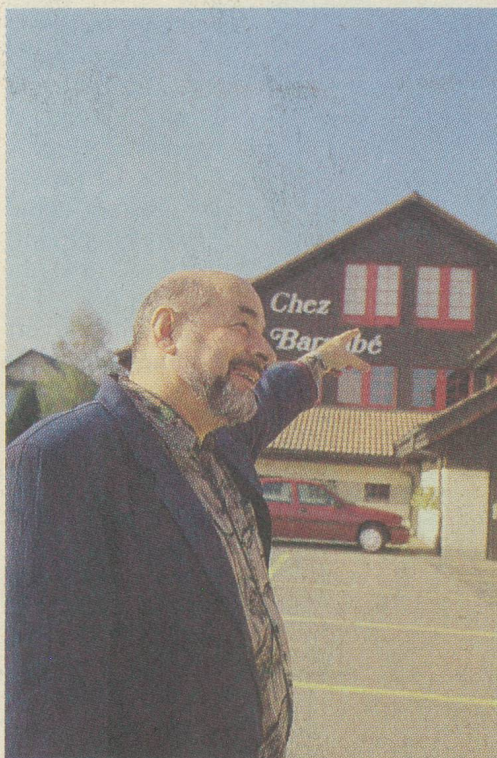
Chez Barnabé, on y vient de partout.

- Je crois que les Savoyards, les gens d'Evian, de Thonon ou d'Annemasse savent tous ce qu'est une «panosse» ou du «chenit». Des liens se sont tissés au fil des ans et le Léman représente une sorte de dénominateur commun. Des gens de Belfort ou de Pontarlier, à qui je demandais ce qui les attirait ici, m'ont répondu: «Cela fait partie de notre culture. On est plus proche de Servion que de Paris... Et c'est moins cher...»