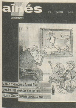
Illustration André Paul

A 74 ans, André Paul n'a rien perdu de son humour et de sa verve. Découvrez son talent en page 24.