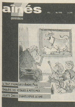
Illustration André Paul

A 74 ans, André Paul n'a rien perdu de son humour et de sa verve. Découvrez son talent en page 24.