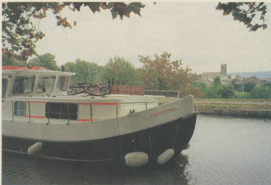
Capitaine d'une péniche au fil de l'eau...

Chaque année, les CFF proposent un certain nombre d'excursions accompagnées (renseignements dans toutes les gares de Suisse). En outre, les agences