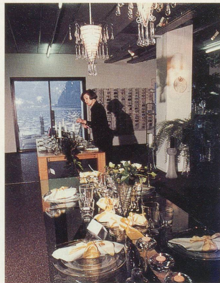
La boutique «Glasi» et ses trésors