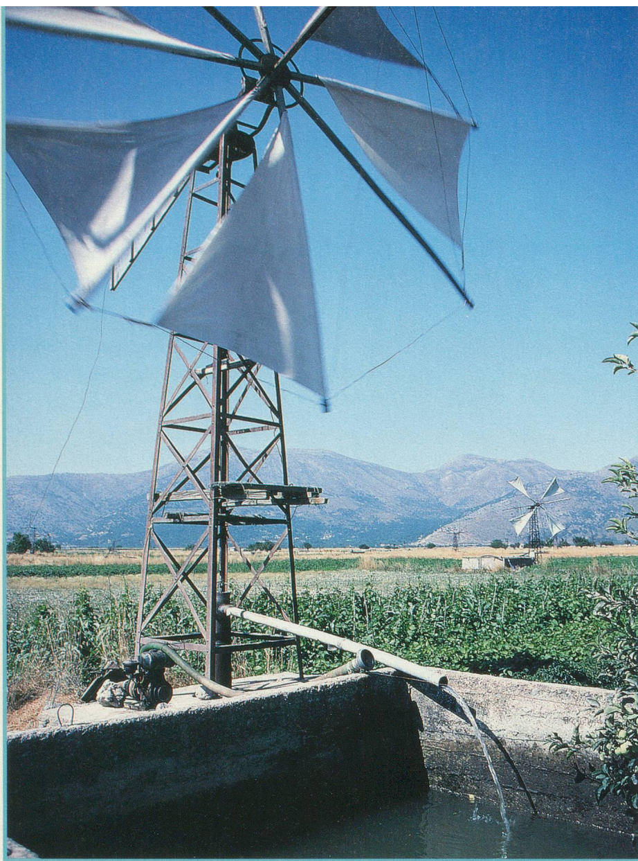
Le plateau du Lassithi et le charme de ses moulins à vent

Cette passion, qui peut même aller jusqu'à la violence, a vraisemblablement été forgée par le cours des événements de l'histoire auxquels les Crétois ont assisté. Ils ont subi le