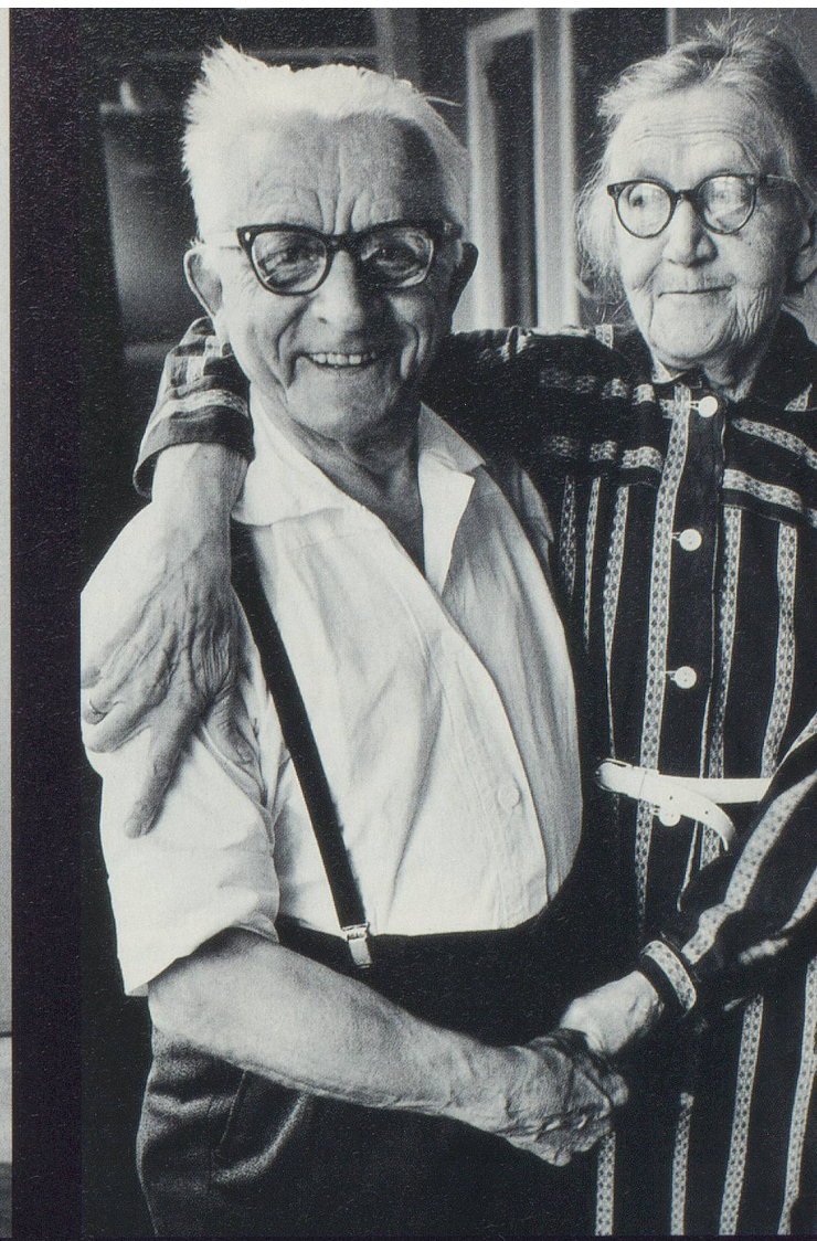
Deux amoureux du troisième âge au Danemark