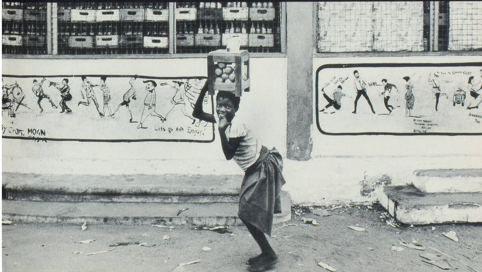
Marchande d'oranges à Accra, Ghana