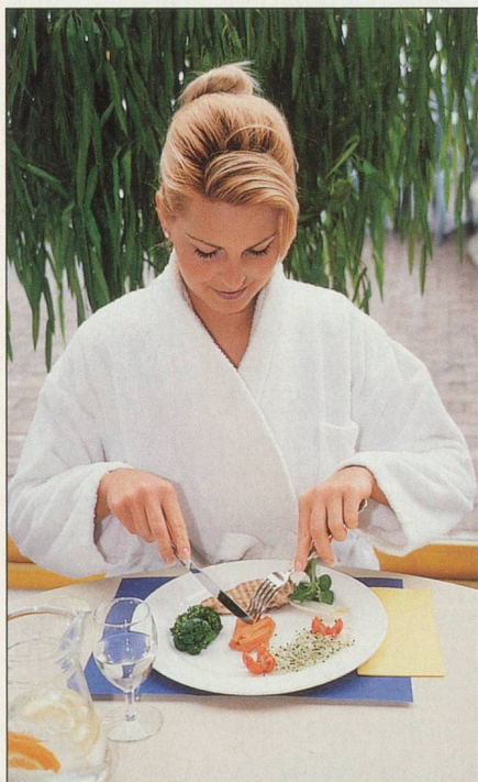
Programmes minceur et conseils en diététique pour une cure de quelques jours

A côté du secteur bains, le centre a développé un espace appelé «Carpe diem». Ce nom, emprunté à la philosophie épicurienne, signifie «mets à profit le jour présent» et évoque le plaisir de la détente. L'entrée à ce lieu réservé aux adultes, pour en garantir le calme, est indépendante des bains. La nudité est de rigueur, mais ne présente pas un caractère obligatoire. Autour d'un bassin rond, trois hammams sont disposés, à des degrés d'humidité et de chaleur variables. Un sauna et son bassin froid sont situés à l'extérieur. Des pédiluves permettent également de se rafraîchir. Des chaises-longues, devant de grandes baies vitrées, invitent au repos, tandis qu'on peut siroter des jus de fruits dans le petit bar installé au centre du «Carpe diem».