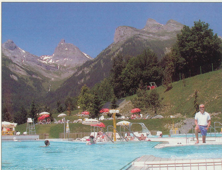
Ovronnaz, des bains au cœur des montagnes