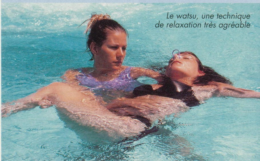
Le watsu, une technique de relaxation très agréable

Chaque centre cherche à apporter une touche originale dans ses installations. A Yverdon, les clients découvriront l'automne prochain les bienfaits du bain japonais à 42°. Une zone fitness est également en préparation, accessible sur abonnement. Les soins du visage seront détachés de l'hôtel et ouverts aux clients du centre thermal, moyennant rendez-vous, pour des séances de massage relaxant et des soins de la peau.