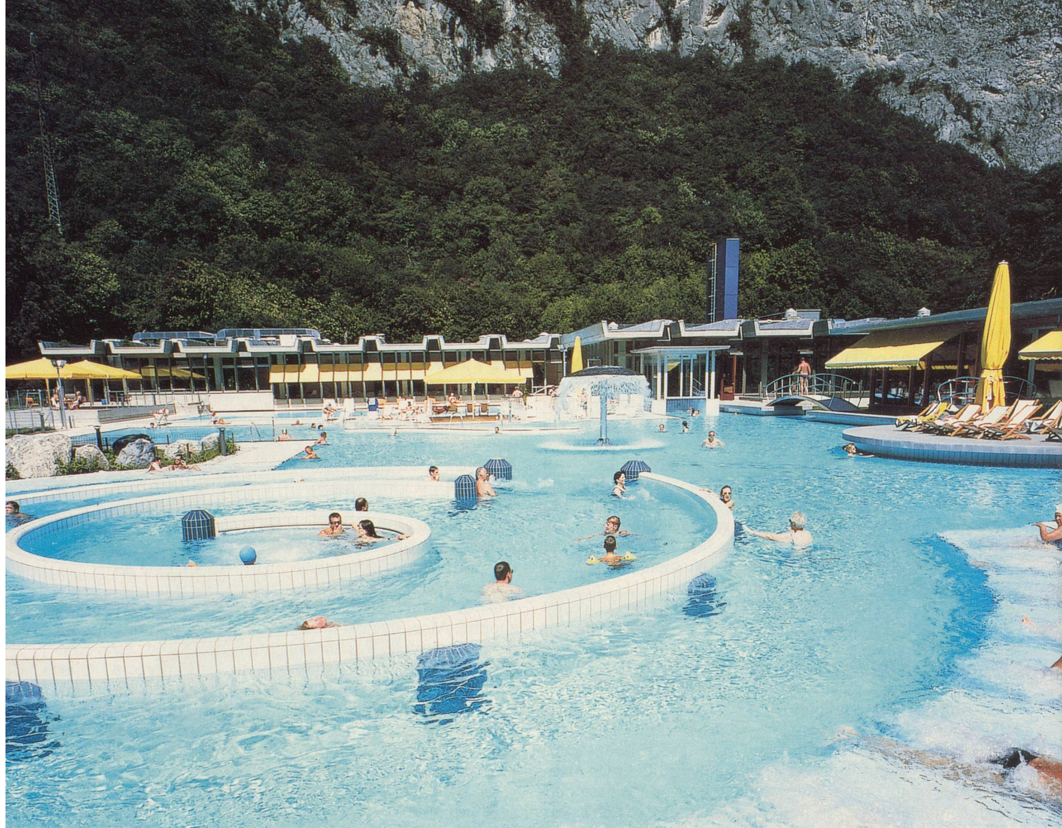
Lavey, une installation toute neuve, des bains splendides