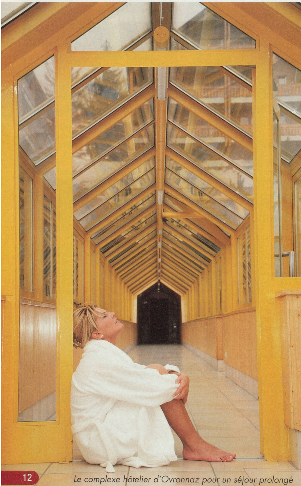
Le complexe hôtelier d'Ovronnaz pour un séjour prolongé