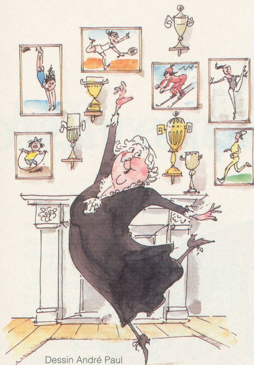
Dessin André Paul

négligeable. Chez l'homme comme chez la femme, elle a pour cause une diminution des fonctions hormonales, même si cette dernière est plus lente et plus progressive chez l'homme que chez la femme.