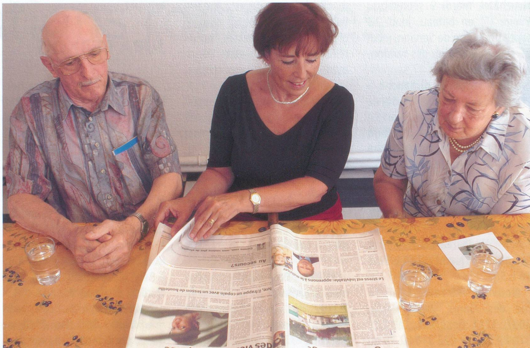
Thierry Parel / Rezo

Dans le souci de faciliter le maintien à domicile des personnes âgées, les EMS genevois mettent à disposition des unités d'accueil temporaire. Ces UAT viennent de baisser leurs prix et se réorganisent par l'entremise de Pro Senectute.