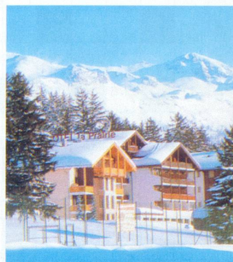
Hôtel La Prairie, à Montana

Côte d'Azur - Cap Soleil , 3 pièces/6 personnes, loggia, lave-linge, lave-vaisselle, téléphone, télévision, coffre-fort, vue + accès mer, piscine, tennis, site exceptionnel, dès Fr. 395.-. Tél. 022 792 79 92.