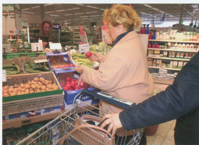
Prévention suisse de la criminalité, Neuchâtel