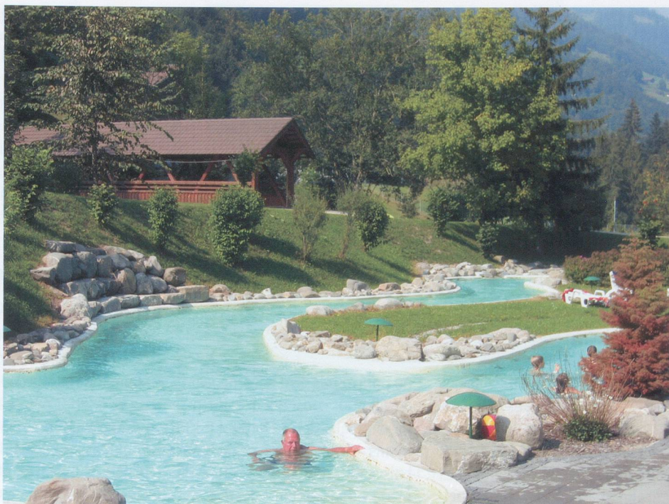
L'eau de la rivière thermale de Val-d'Illiez est pure comme à la source.

Hébergement (avec accès direct): Hôtel**** des Bains de Saillon, tél. 027 743 11 12.