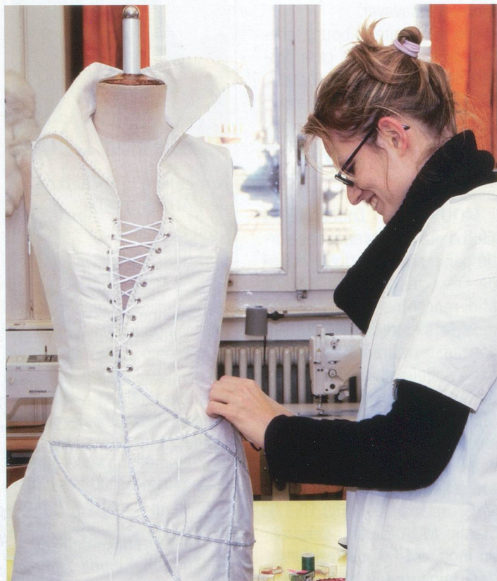
Travail sur toile pour cette couturière en herbe.

La confection de vêtements sur mesure apparaît comme un véritable luxe. Sans pousser la porte d'un salon de couture réputé, il est pourtant possible de faire confectionner un modèle unique et inédit.