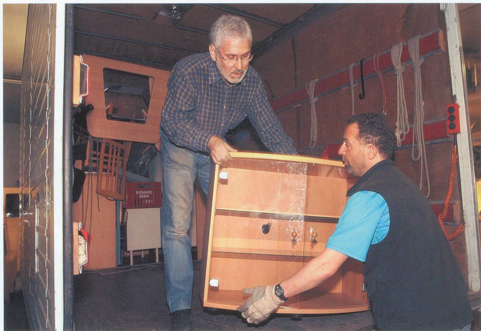
Au Troc (photo p. 27) ou chez Emmaüs, vos meubles ont une deuxième vie.

Quelques conseils: ne jamais accepter la proposition d'un brocanteur sans délai de