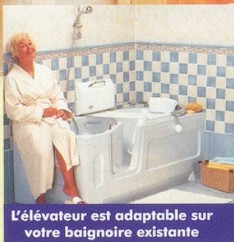
L'élévateur est adaptable sur votre baignoire existante

Pour votre sécurité et indépendance du bain: demandez notre brochure en couleurs gratuite!