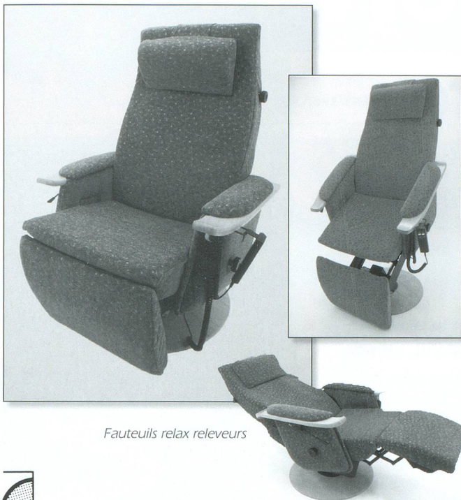
Fauteuils relax releveurs

Des professionnels au service de personnes handicapées ou âgées