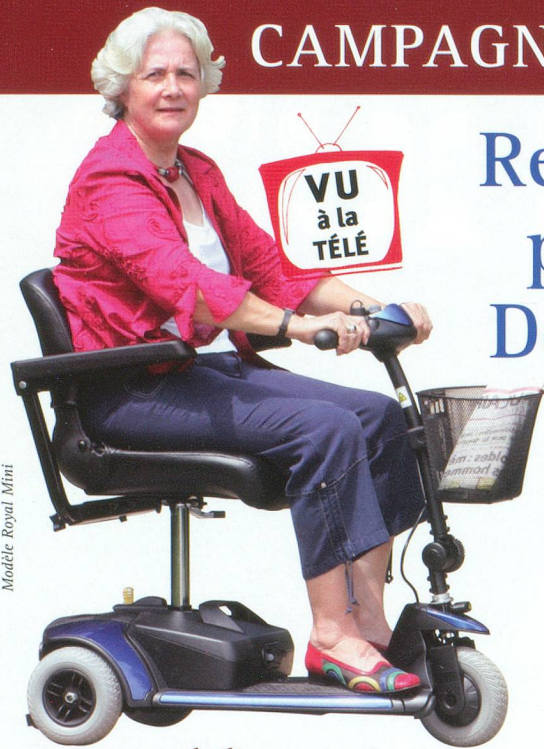
Modèle Royal Mini