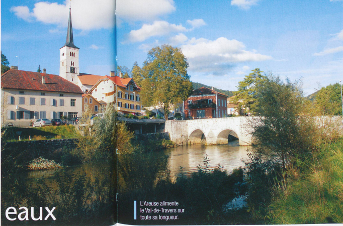
L'Areuse alimente le Val-de-Travers sur toute sa longueur.