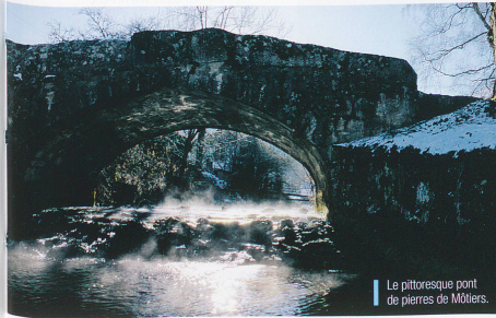
Le pittoresque pont de pierres de Môtiers.

Depuis la correction de ses eaux, l'Areuse, endiguée et canalisée, n'inonde plus, ne fait plus frémir les ponts. A loisirs, on peut remonter tous les affluents, chaque pont menant à une découverte. Simples passerelles, ponts de fer «à la Eiffel» ou vieux ponts de pierre à arches comme celui de Travers, le plus beau, avec ses armoiries: trois belles truites servies sur un écusson. Les pêcheurs ne s'y trompent pas, allant jusqu'à disputer ouvertement du bon droit des hérons cendrés! Et là où il n'y aurait pas encore de pont, l'on peut toujours franchir le gué en sautant comme les grenouilles d'une pierre à l'autre, à