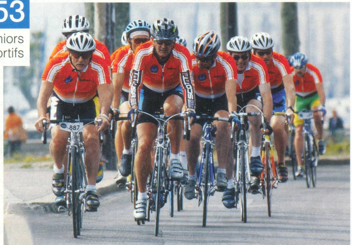
Cyclotour du Léman