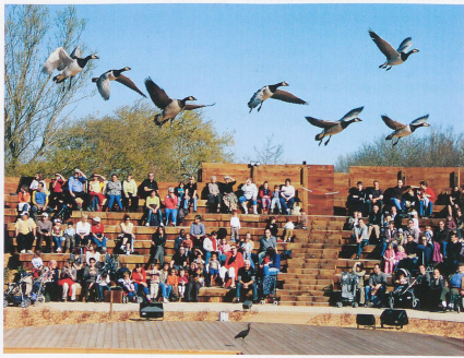
Le spectacle dans l'arène de bois permet d'observer les oiseaux en vol.