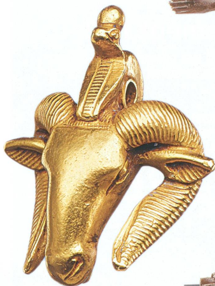
Tête de bélier (4 cm), 747-664 av. J.-C.