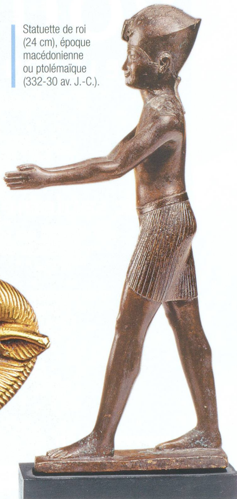
Statuette de roi (24 cm), époque macédonienne ou ptolémaïque (332-30 av. J.-C.).