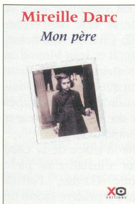
Mon Père , Mireille Darc. XO Editions.

Sensible aux signes les plus subtils que nous adresse la vie, Mireille Darc a su prendre le meilleur de cette aventure pour le moins inhabituelle. Avec Mon Père , elle nous livre un témoignage magnifique: celui de cette femme amoureuse que fut sa mère; et celui de l'infinie tendresse qu'elle voue aujourd'hui aux héros de sa propre histoire. «Si la vérité a un lien quelconque avec le bonheur, avec la paix intérieure, alors je n'ai plus aucun doute: pour la première fois de ma vie déjà longue je me sens heureuse et légère.» ■