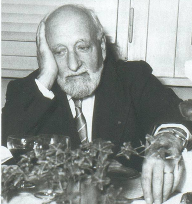
Ernest Ansermet (1883-1969), chef d'orchestre suisse.