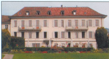
Nouvelle Roseraie - St-Légier (VD) 480 m