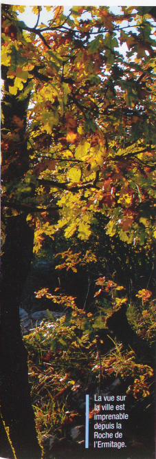
La vue sur la ville est imprenable depuis la Roche de l'Ermitage.