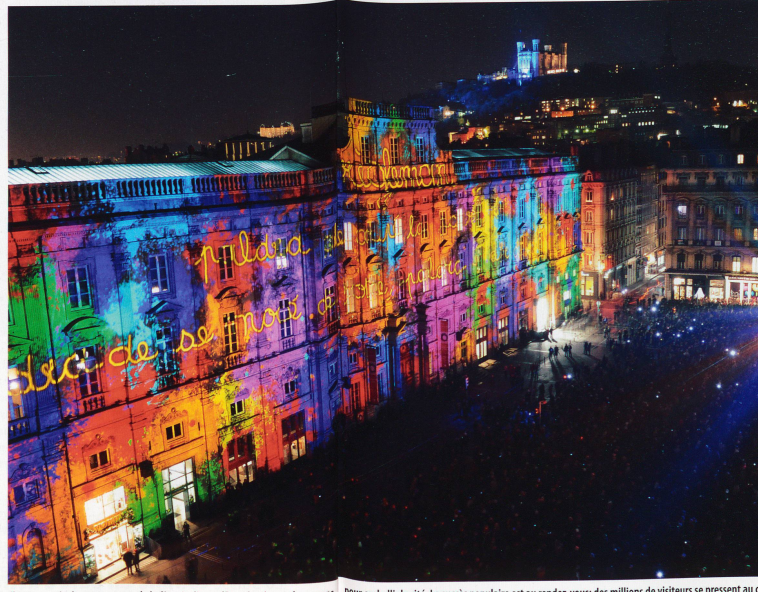
Chaque année, les concepteurs de la fête rivalisent d'imagination et de moyens

Et la légende veut qu'en 1850, l'archevêque de Lyon décide de couronner la chapelle de Four-