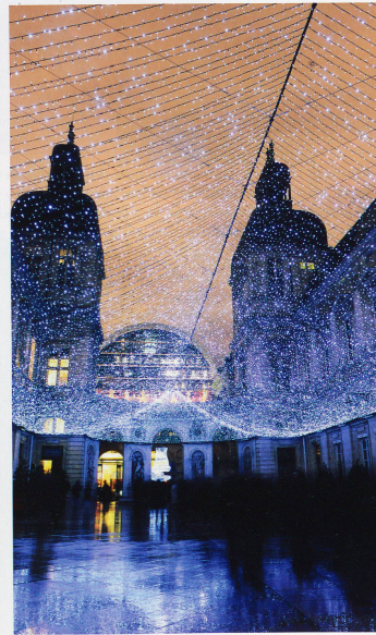
pour embellir la cité. Le succès populaire est au rendez-vous: des millions de visiteurs se pressent au cœur de la nuit. Pour quatre représentations uniques.

En se promenant dans les rues du vieux Lyon, on voit encore ici et là aux fenêtres trembloter les