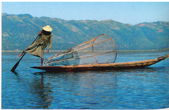
Les pêcheurs du lac Inle dansent avec leur pagaie pour faire avancer leurs pirogues.

Bien sûr, il n'est pas possible d'aller partout et de parler de tout. Même si elles s'ouvrent peu à peu, de nombreuses régions du Myanmar sont interdites aux étrangers. Dans les années 90, les montagnes de Kyaiktiyo et le célèbre Rocher d'Or étaient inaccessibles aux voyageurs. Et pourtant, avec la complicité et les rires des Birmans, il était possible de dormir au pied du rocher en équilibre précaire et