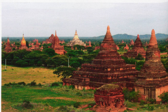
Bagan est le site archéologique le plus impressionnant d'Asie du Sud-Est. Sur la plaine abandonnée, des centaines de pagodes et de stupas s'élèvent vers le ciel. Derniers vestiges d'une civilisation disparue.

Autre vision de rêve, aussi inattendue que surprenante: le lac Inle. Au pied de collines verdoyantes, cet espace de fraîcheur est un petit coin de paradis. Les nuages s'y reflètent comme dans un miroir