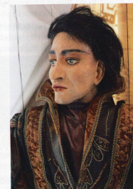
Roméo évidemment, inspiré du personnage de William Shakespeare, romantique et ténébreux.