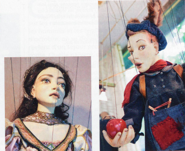
Pinocchio, le célèbre héros du roman de Carlo Collodi (1878), qui gagnera le droit à devenir un vrai petit garçon.