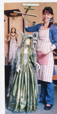
Juliette n'est jamais très loin de Roméo avec qui elle va découvrir la passion jusqu'à la mort.