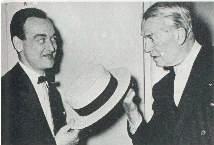
Chapeau bas, la rencontre avec un très grand monsieur de la scène en 1957, au Casino Théâtre de Genève: Maurice Chevalier en personne.

genevois souffle ses 90 bougies en brûlant de spectacle.