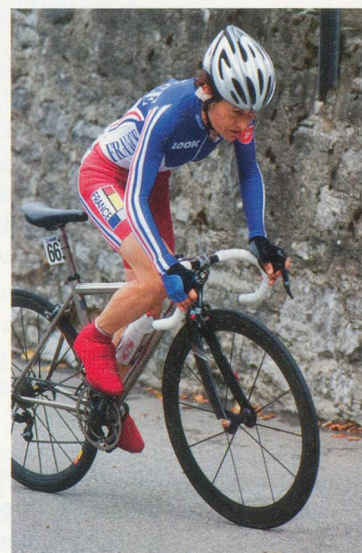
Jeannie Longo a terminé 4 e des derniers Mondiaux de Mendrizio en 2009.