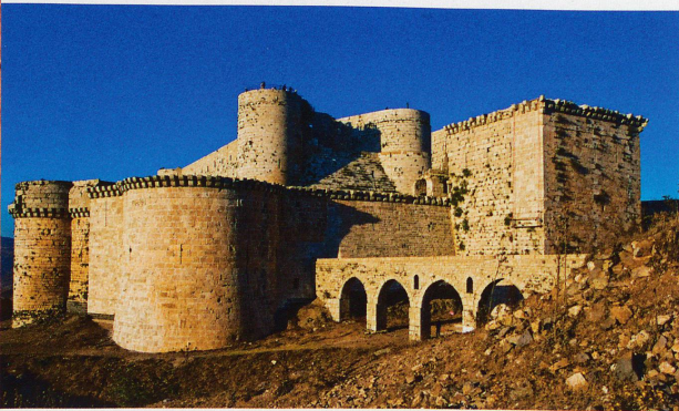
Le Krak des chevaliers n'a jamais été pris par la force. Il a fallu une ruse du Sultan pour que les Croisés abandonnent la place, croyant obéir à un ordre du grand maître des Templiers.

La Syrie et la Jordanie vous tentent? Alors partez avec Génération Plus . Découvrez notre offre de voyage en page 81.