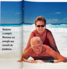
Madame a compris. Monsieur est aveugle aux conseils de prudence.