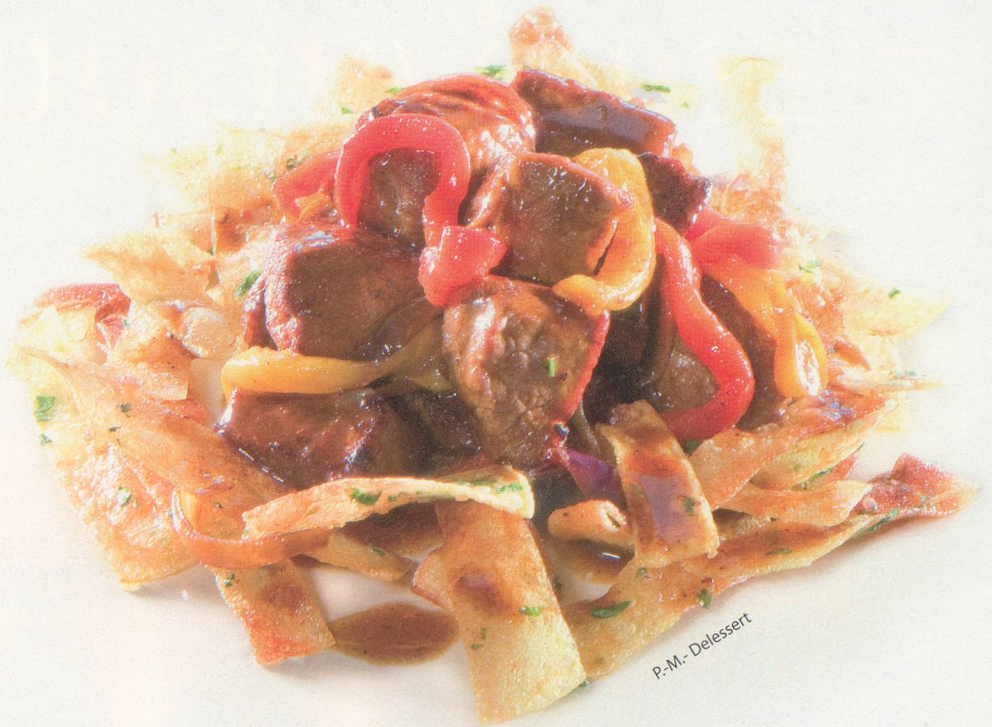
P.-M. - Delessert